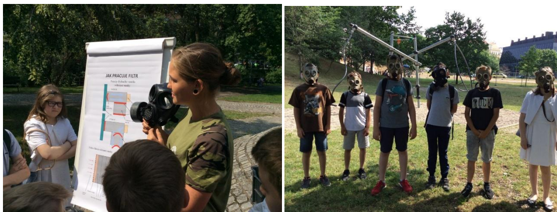
Foto č. 9 a 10: Branný den, který pro naše žáky připravila MČ Praha 2