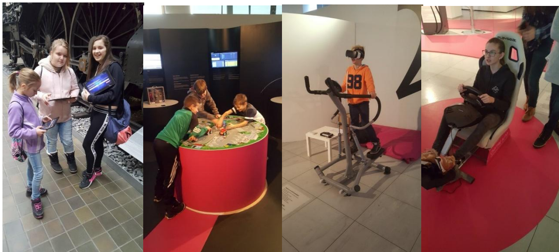
Foto č. 19,20,21,22: Návštěva 6. ročníku v Národním technickém muzeu

V červnu se skupina 40 žáků převážně druhého stupně vypravila na jeden den do Německa, aby zde účastníci strávili den plný vodních radovánek v objektu zvaný Tropical Islands. Kromě